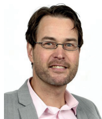
Projectleider en advies