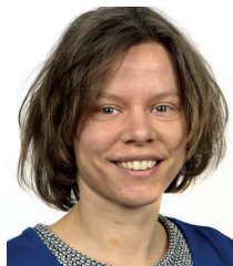
Helpdesk en planning